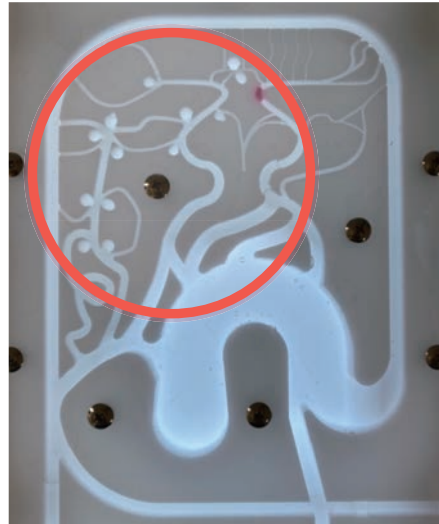
分岐部直後の動脈瘤