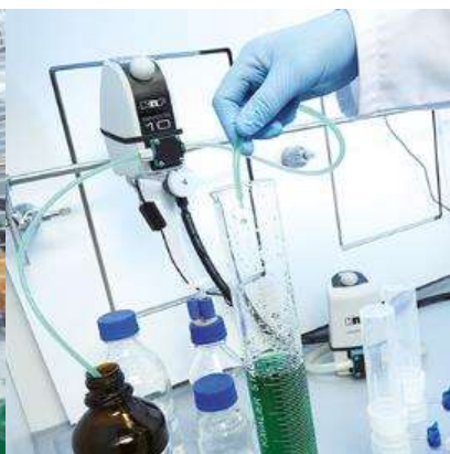
Liquid transfer and dosing