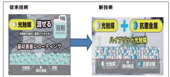
従来技術と新技術の比較

いわゆる産学官連携については、前述のように、2001年度に世界的にも優位性の高い溶射技術を開発するため、北九州市の産学官支援部署の支援から始まり、大学としては九州大学と九州工業大学、官としては福岡県工業技術センターの機械電子研究所と北九州産業学術推進機構（FAIS）との連携形態に発展していった。