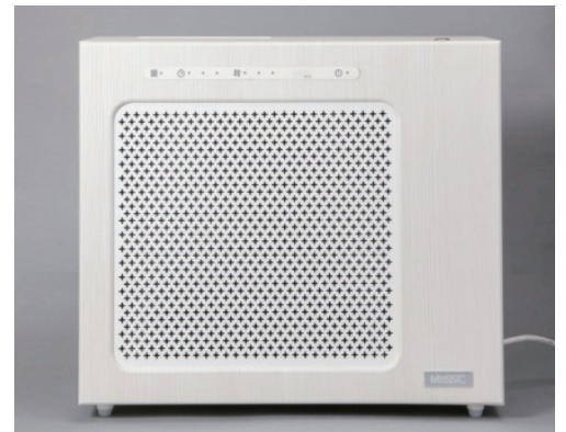
写真2 空気消臭殺菌装置 MaSSC クリーン